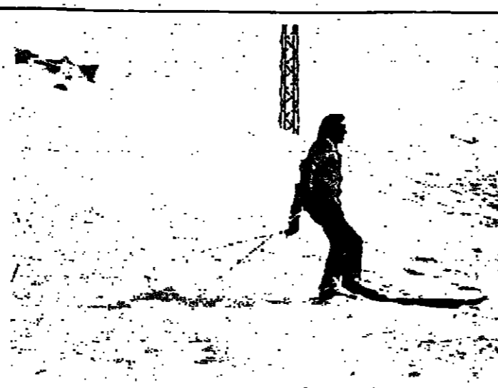
متزلج يمارس هوايته

وزير التربية يؤكد افادة المعلمين من الحد الأدنى للاجور